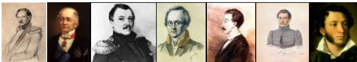
Портреты первых выпускников.

Первый выпуск лицея был самым блистательным – ведь именно тогда учились А.С. Пушкин, А. Дельвиг, И. Пущин, А. Горчаков, В.Кюхельбекер, Ф. Матюшкин, К.Данзас и другие.