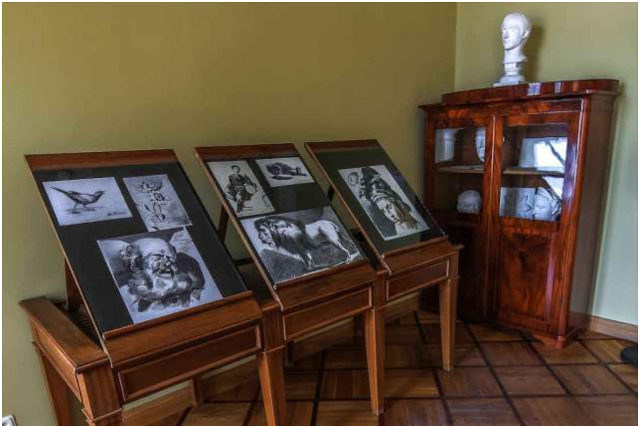
Рисунки, сделанные Пушкиным.

Несмотря на то, что учеба отнимала много сил и времени, ученики успевали заниматься выпуском собственной рукописной газеты, где делились стихами, рассказами, эпиграммами и карикатурами на своих друзьях.