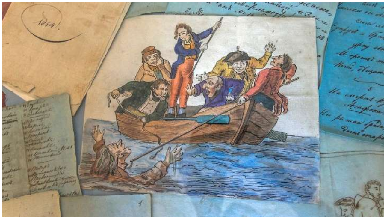
Страницы из рукописных журналов лицея.