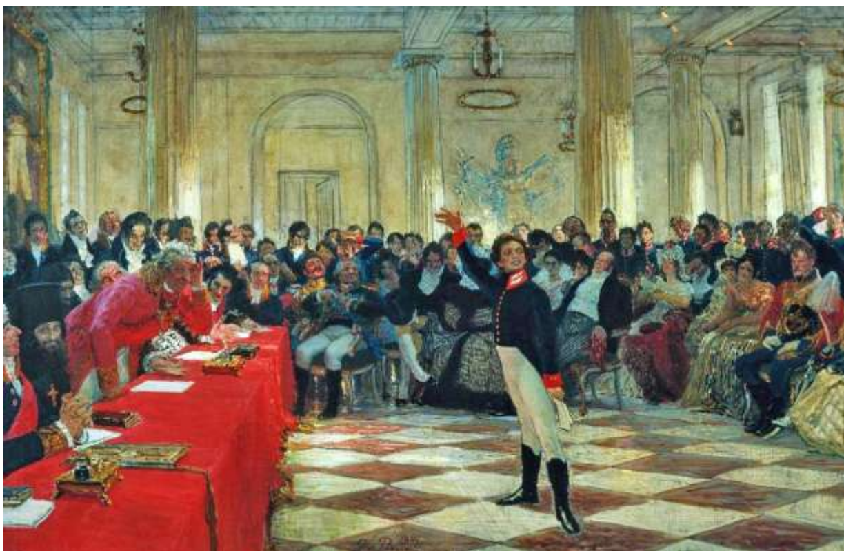
Репин И. "Пушкин на лицейском экзамене в Царском Селе 8 января 1815 года"

Романович Державин. На экзамене по российской словесности Пушкин читал специально написанное для этого дня стихотворение «Воспоминания в Царском Селе». Много лет спустя, вспоминая этот день, Пушкин напишет: «Державина видел я только однажды в жизни, но никогда того не забуду... Державин был очень стар... Он дремал до тех пор, пока не начался экзамен в русской словесности. Тут он оживился, глаза заблестали; он преобразился весь... Наконец вызвали меня. Я прочел мои «Воспоминания в Царском Селе», стоя в двух шагах от Державина. Я не в силах описать состояния души моей: когда дошел я до стиха, где упоминаю имя Державина, голос мой отроческий зазвенел, а сердце забилось с упоительным восторгом... Не помню, как я кончил свое чтение; не помню, куда убежал. Державин был в восхищении; он меня требовал, хотел меня обнять... Меня искали, но не нашли». Так, в пятнадцать лет, к Пушкину пришла первая поэтическая слава.